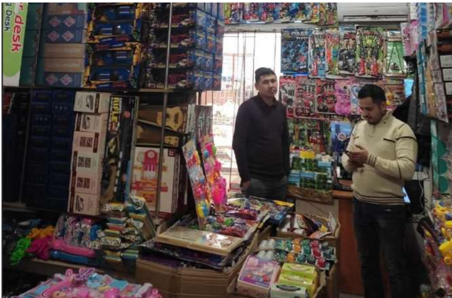
Foto: Kunde von Delta in seinem Laden

Die Mikrofinanz-Organisation Delta Mikromoliya Tashkiloti LLC wurde 2013 von erfahrenen Mikrofinanzexpert*innen gegründet. Der Schwerpunkt des Unternehmens liegt auf dem Kreditgeschäft zu günstigen Konditionen. Neben unbesicherten Mikrofinanzkrediten an Privatpersonen und kleine Unternehmen werden u.a. auch Autokredite vergeben (d.h. besicherte Kredite), welche in der Regel auch einen Bezug zum Erwerbseinkommen der Kreditnehmer*innen aufweisen.